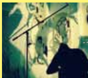
sonsen gocha bacco